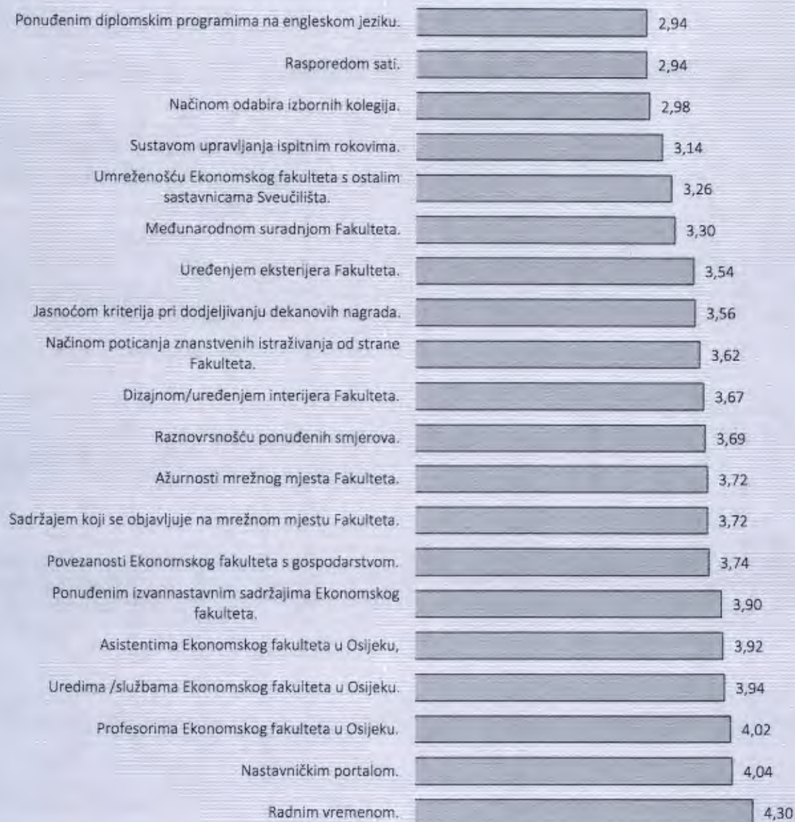
Grafikon 2: Deskriptivan opis općenitih izjava o Ekonomskom fakultetu u Osijeku

U daljnjim preporukama ističe se kako je potrebno usporediti zadovoljstvo radom Ureda Fakulteta (istraživanje nastavnog osoblja) sa zadovoljstvom radom Ureda Fakulteta koje navode studenti EFOS-a. Osim toga, preporuča se kontinuirano ocjenjivanje zadovoljstva radom Fakulteta općenito od strane nastavnog i nenastavnog osoblja.