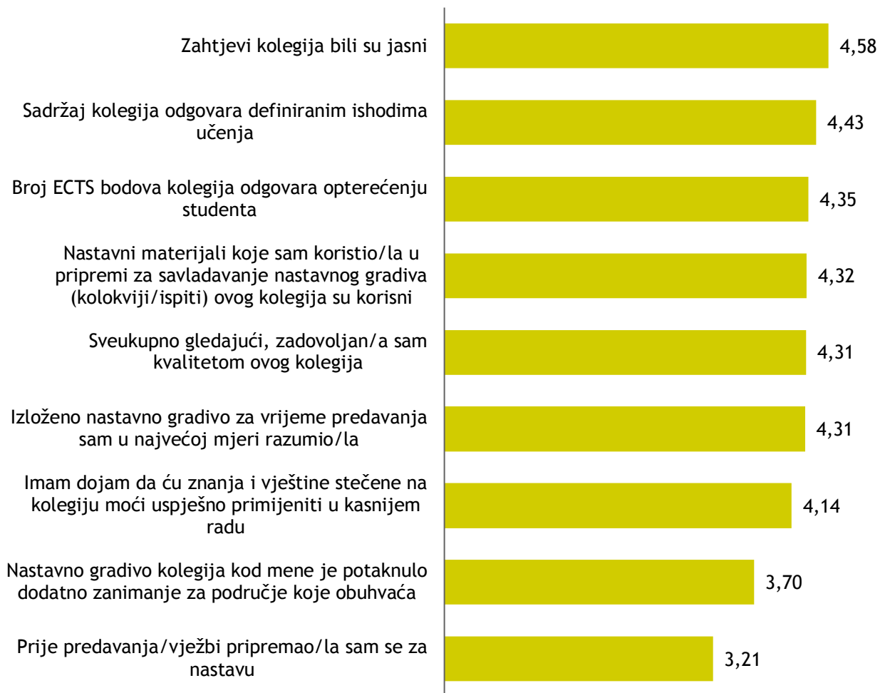
Grafikon 1: Prosječne ocjene za ukupnu kvalitetu svih kolegija EFOS-a