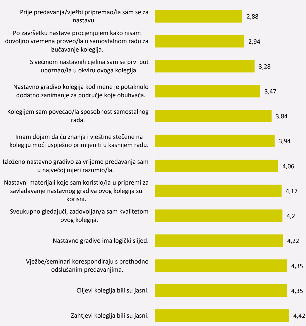
Grafikon 1: Prosječne ocjene za ukupnu kvalitetu svih kolegija EFOS-a